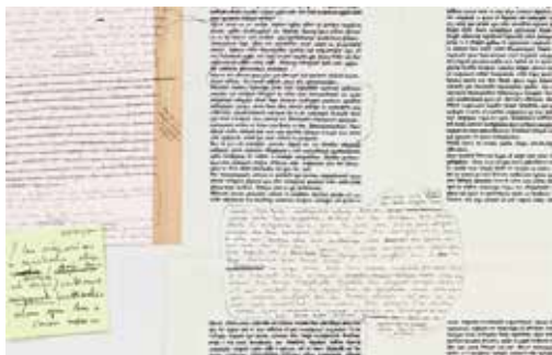
Laurence Cathala, Scriptio continua , 2023 (détail) Papiers, gouaches, déplié : 316 x 226 cm © tous droits réservés

En tant que chercheuse mais aussi en tant qu'écrivaine, et enfin en tant que critique d'art, je mène depuis plusieurs années une sorte d'enquête. Celle-ci consiste à interroger des écrivaines et écrivains, des artistes, des poétesses et poètes sur leur rapport à l'écriture à travers la question du geste. Que signifie et représente pour elles et eux, le geste d'écrire. Leurs réponses permettent d'élaborer un territoire de « scription » propre aux pratiques contemporaines, où s'entrelacent singulièrement les mots et les images à travers le corps. Cette conférence racontera l'histoire de cette enquête et quelques-unes des réponses, en mots et en images, reçues.